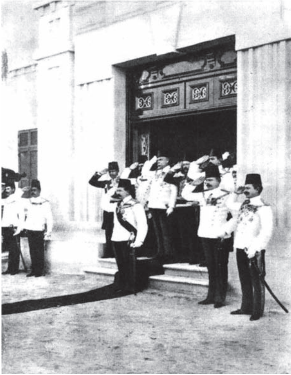
الخدو عباس خارجًا من سراي الحاكم العام للسودان، حين زيارته للسودان ١٩٠٢.

رأت الحكومة أن أمضي في مفاوضاتي الخاصة بالحدود ما بين إيطاليا ومصر؛ لأنني كنت قد ألمت بأطرافها، بل ذهبت إلى إيطاليا لمقابلة موسوليني بشأنها، فكانت النتيجة في آخر الأمر أن جرى الاتفاق، الذي صورته السياسة الحزبية بصورة سوداء كعادتها. كان هم مصر في هذا الاتفاق أن تحصل على خليج السلوم، وعلى الهضبة التي تعلو السلوم، والمنطقة التي حولها إلى بلدة بردية غربًا، وكان الإيطاليون قد احتلوا هذا المكان الذي يشرف على هذه المدينة المصرية، فكانت هذه المنطقة هي التي تهم مصر؛ لأنها تشرف على أراضيها؛ ولأنها هي الطريق الذي يستطيع أي غاصب أن يدخل منه البلاد