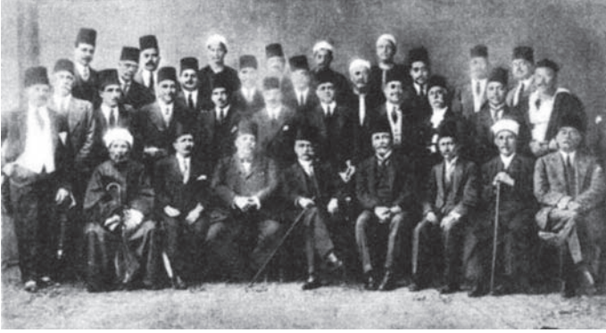
أعضاء لجنة الدستور يتوسطهم حسين رشدي باشا رئيس اللجنة.

ولكن كثيراً من هؤلاء يابون أن يخوضوا معامع الانتخاب؛ صوناً لكرامتهم عن المنازعات والمناضلات؛ لذلك تفتح لهم في كثير من البلاد أبواب مجلس الشيوخ، وسواء أكان الدخول فيه بطريق التعيين أو بطريق الانتخاب، فإنه لإبعاد مزاحمة طوائف محترفي السياسة، رأيت أن يشترط فيمن يدخله شروط خاصة من الوظائف أو الأعمال، أو الصناعات أو الثروة، وزدت في الدستور نسبة المعينين في هذا المجلس من خمسه إلى ثلاثة أخماسه، فأصبحت نسبة المعينين من الشيوخ أكثر من المنتخبين، حتى لا تحرم البلاد من خدمات عدد من رجالها الأكفاء.