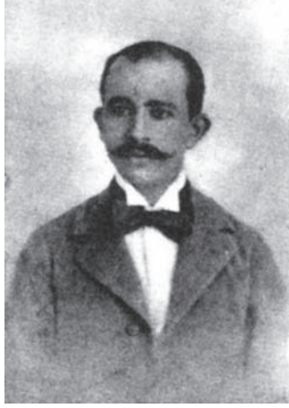
إسماعيل صدقي باشا في سن العشرين ... حينما كان في وظيفة مساعد نيابة في بلدة إيتاي البارود.