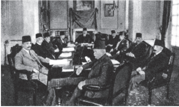
وزارة أحمد زيور باشا أثناء اجتماعها سنة ١٩٢٥ ويرى إسماعيل صدقي باشا إلى يمين رئيس الوزراء.

وإنني شخصياً لا أؤيد فكرة إنشاء اتفاقات تشمل تعهدات سياسية وعسكرية بين مصر، وبلاد جامعة الدول العربية، فإن هذه الجامعة إنما أنشئت في الواقع على أساس رابطة الأخوة بين أعضائها، الناتجة من التشابه في الجنس واللغة والتاريخ المشترك، وموقع البلاد الجغرافي، وهذه الأخوة تعفي الدول المذكورة من الالتزام بأن تبرم بينها معاهدات سياسية أو عسكرية معينة.