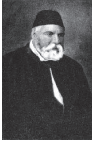
محمد سيد أحمد باشا جد إسماعيل صدقي باشا لوالدته، ورئيس ديوان الأمير محمد سعيد.