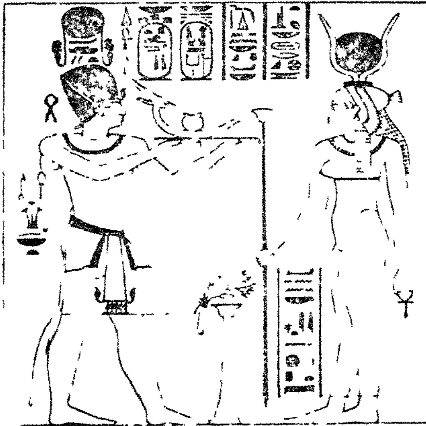
بشيشوس الثاني يقدم اتقدمات الى المعودة يس وهي تقول له ابي المنحك كل قوة وسلطنة مشري السوء