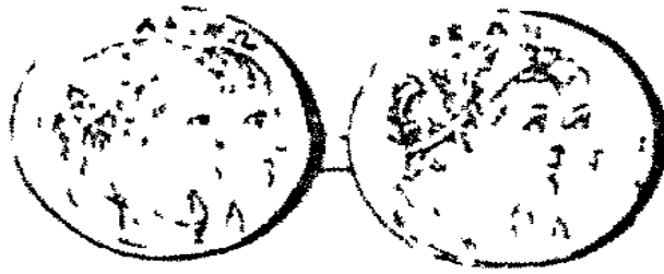
على الوجه الواحد صورة شيشوس الثاني وارسنوي وعلى الوجه الاخر صورة ابي شيشوس الاول وهو بريكي